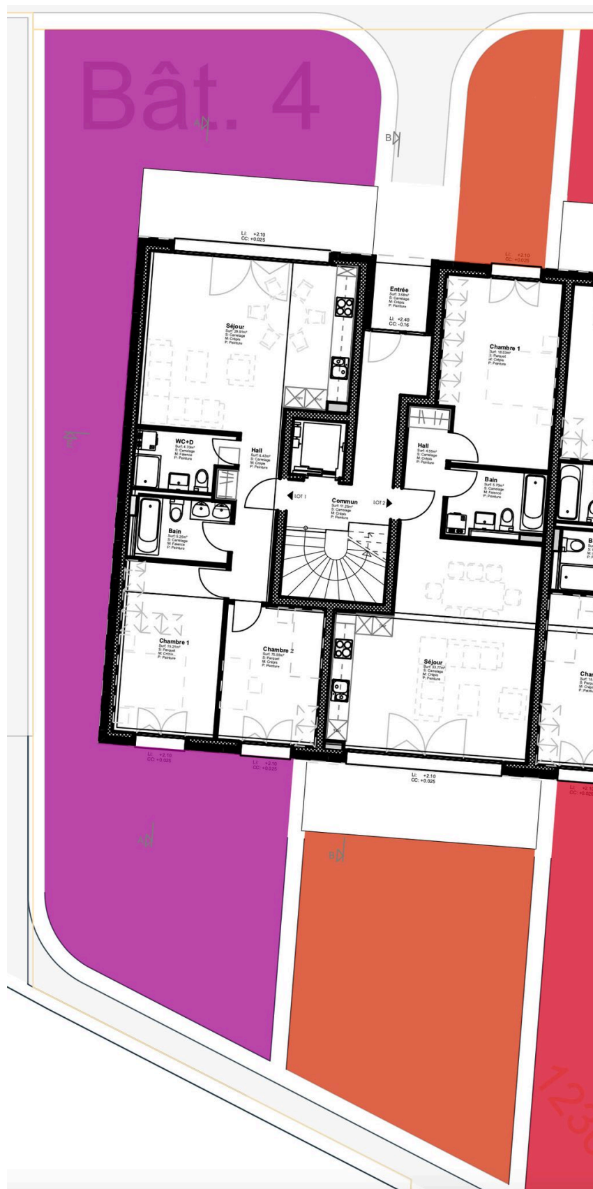
Plan jardin orange - 76 m2

LES VUES DE FORT Sàrl EXPERT EN IMMOBILIER DEPUIS 2002